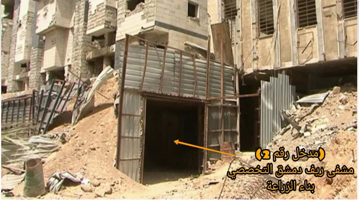
(مدخل رقم 2) مشفى ريف دمشق التخصصي بناء الزراعة

١٣- تظهر في الصورة مشفى ريف دمشق التخصصي (النقطة واحد) المحصنة بشكل كامل، والتي تقع تحت بناء الزراعة قرب دواء الشهداء بمدينة دوما في الغوطة الشرقية.