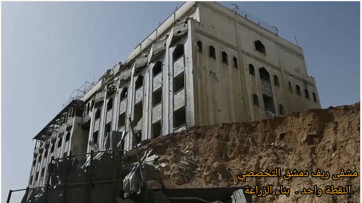
مشفى ريف دمشق التخصصي النقطة واحد - بناء الزراعة

١٣- تظهر في الصورة مشفى ريف دمشق التخصصي (النقطة واحد) المحصنة بشكل كامل، والتي تقع تحت بناء الزراعة قرب دواء الشهداء بمدينة دوما في الغوطة الشرقية.