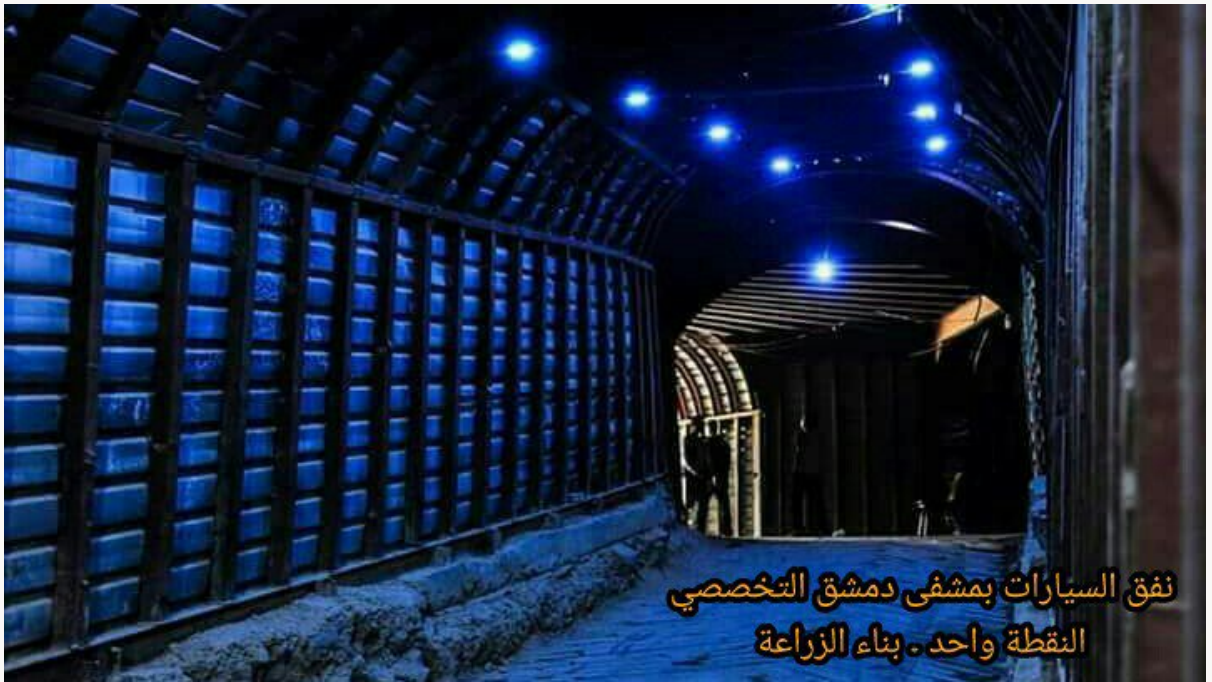
١٦- نفق سيارات الإسعاف الذي يمتد من مشفى ريف دمشق التخصصي (النقطة واحد) إلى أنفاق أخرى بمدينة دوما في الغوطة الشرقية.