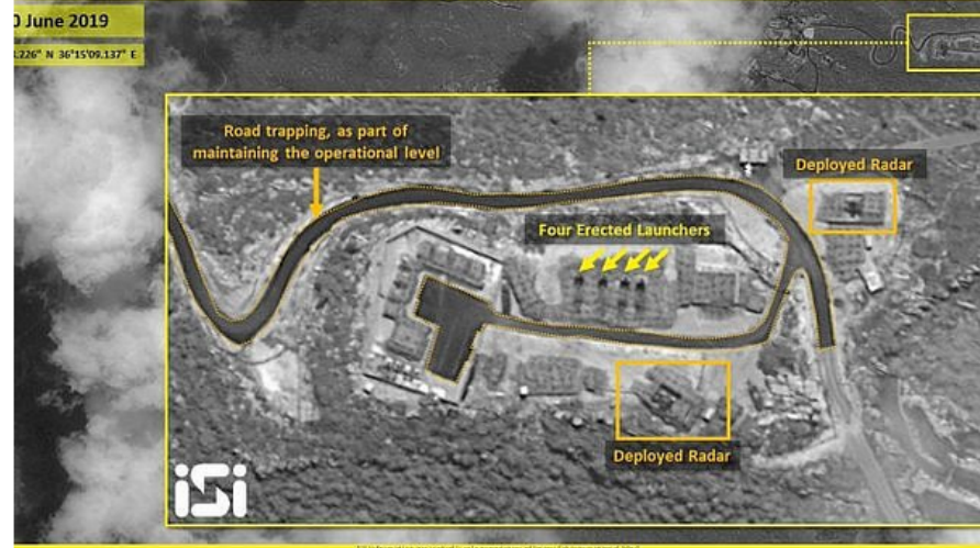
Satellite photos released by ImageSat International appear to show all four missile launchers of the S-300 air defense system in the raised position in the northwestern Syrian city of Masyaf on June 30, 2019.