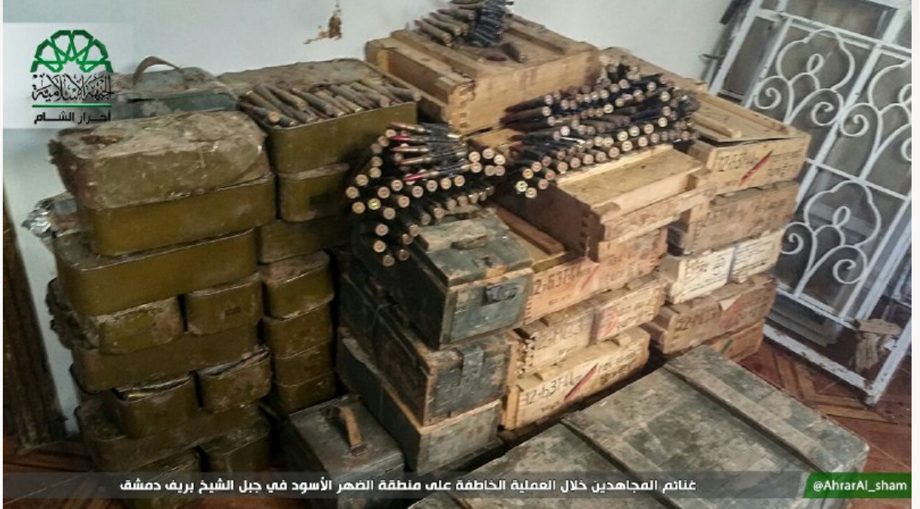
غنائم المجاهدين خلال العملية الخاطفة على منطقة الظهر الأسود في جبل الشيخ بريف دمشق